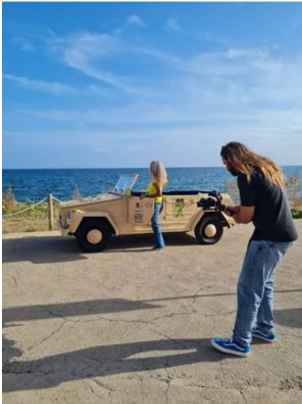
Dreh Kamera 1