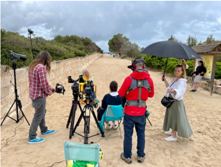
🎬 Regenpause. Kameras ok, Licht ok, Ton ok. Die Regie sagt: Wir drehen.