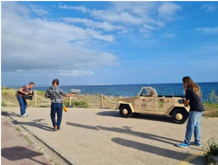
Dreh Kamera 2 links im Bild (mit Tontechniker und Kamera 1)